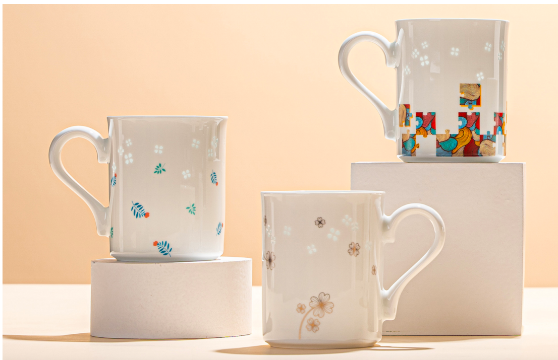
本文瓷器图片属于景德镇富玉陶瓷产品