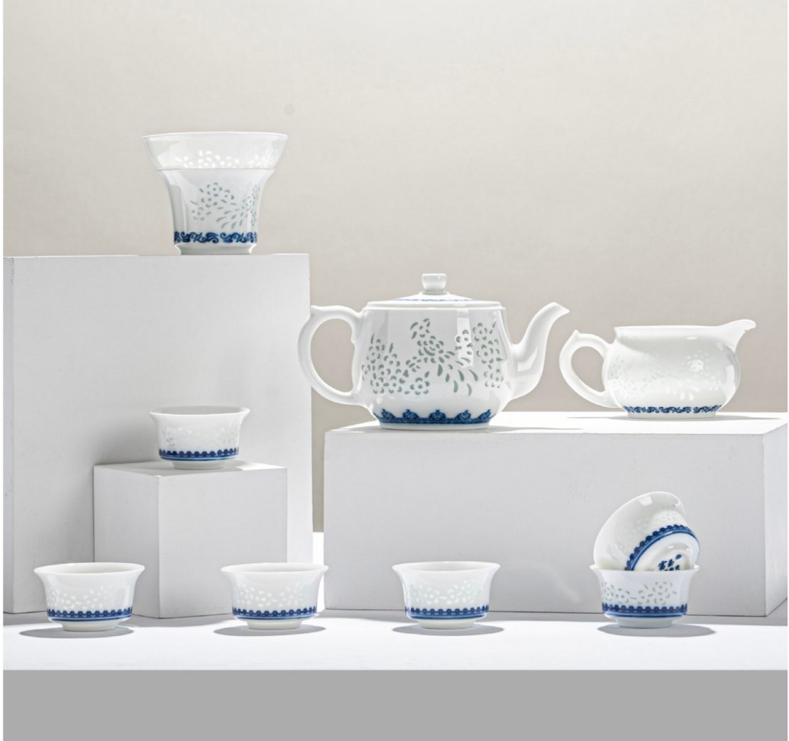
本文瓷器图片属于景德镇富玉陶瓷产品

绿色透明玲珑与精致、宁静、优雅的蓝色混合，形成了一种和谐的融合，釉料在其中完美结合。其艺术特征给观众留下清新纯净的印象，这种品质受到所有人的喜爱。