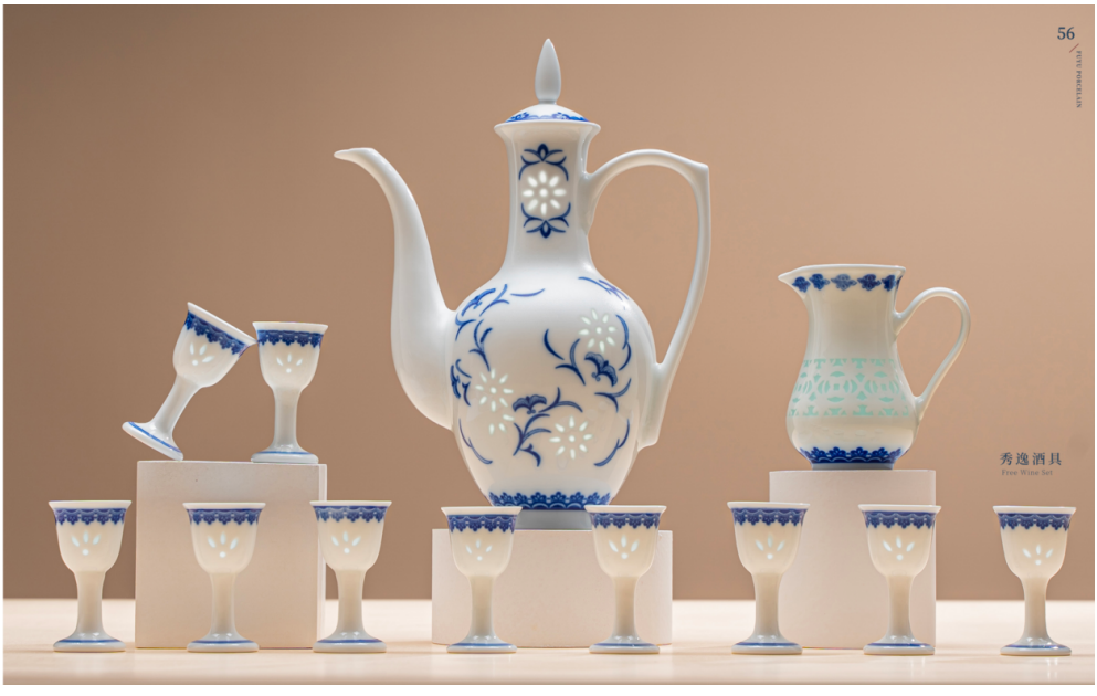
秀逸酒具 Fancy Wine Set