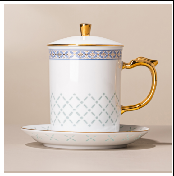
本文瓷器图片属于景德镇富玉陶瓷产品